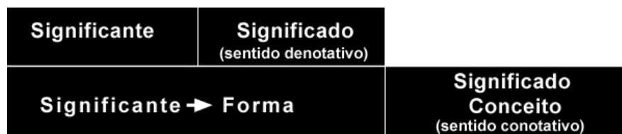
Figura 1 – Sistema Semiológico Segundo. (BARTHES, 2003 p. 158)

O processo de conotação pode ser explicado pelo seguinte quadro do “Sistema Semiológico Segundo” de Barthes: