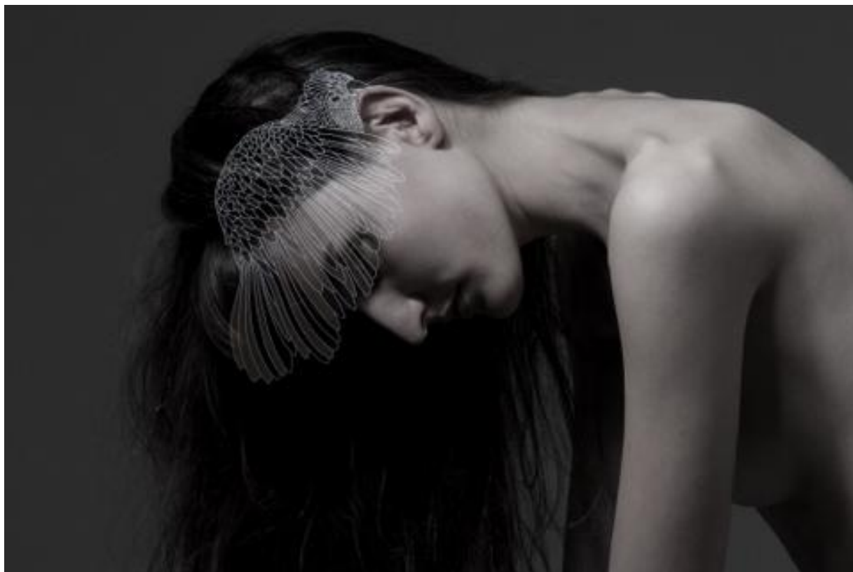
Figura 5 – Quarta Fotografia do Editorial, 2010.

vazio, um vão. Esse espaço vazio nos conota algo que ainda deve ser preenchido. Algo que está carente, oco, ausente. Temos então sentimentos de perda, nostalgia e saudade ligados à essa mulher.