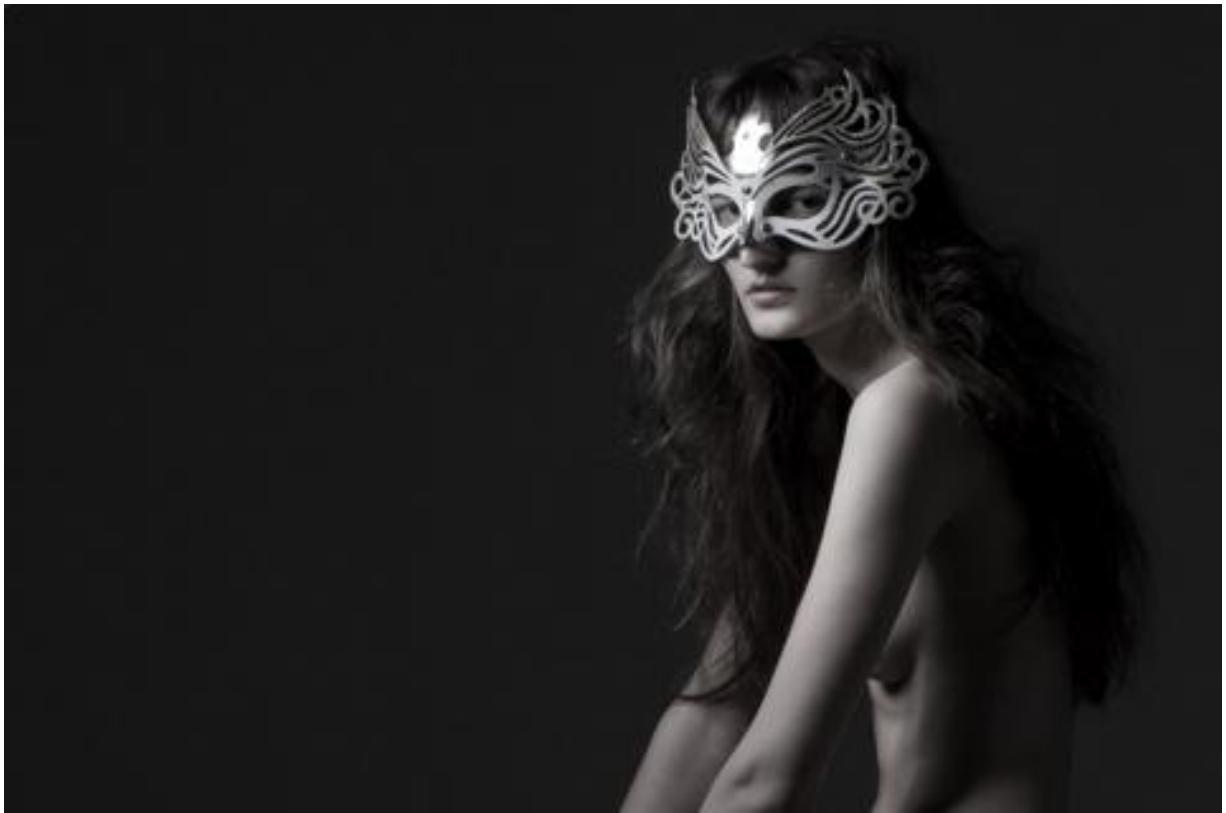
Figura 4 – Terceira Fotografia do Editorial, 2010.