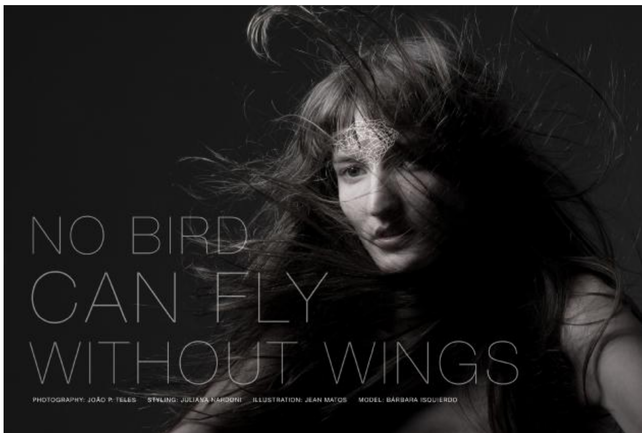
Figura 2 – Capa do Editorial, 2010.

A seguir a capa, primeira foto, do editorial. O editorial ainda não foi publicado em nenhum veículo, mas a ideia é mandá-lo para alguma revista online ou site internacional que tem o hábito de publicar materiais como esses, com alto teor artístico e conceitual.