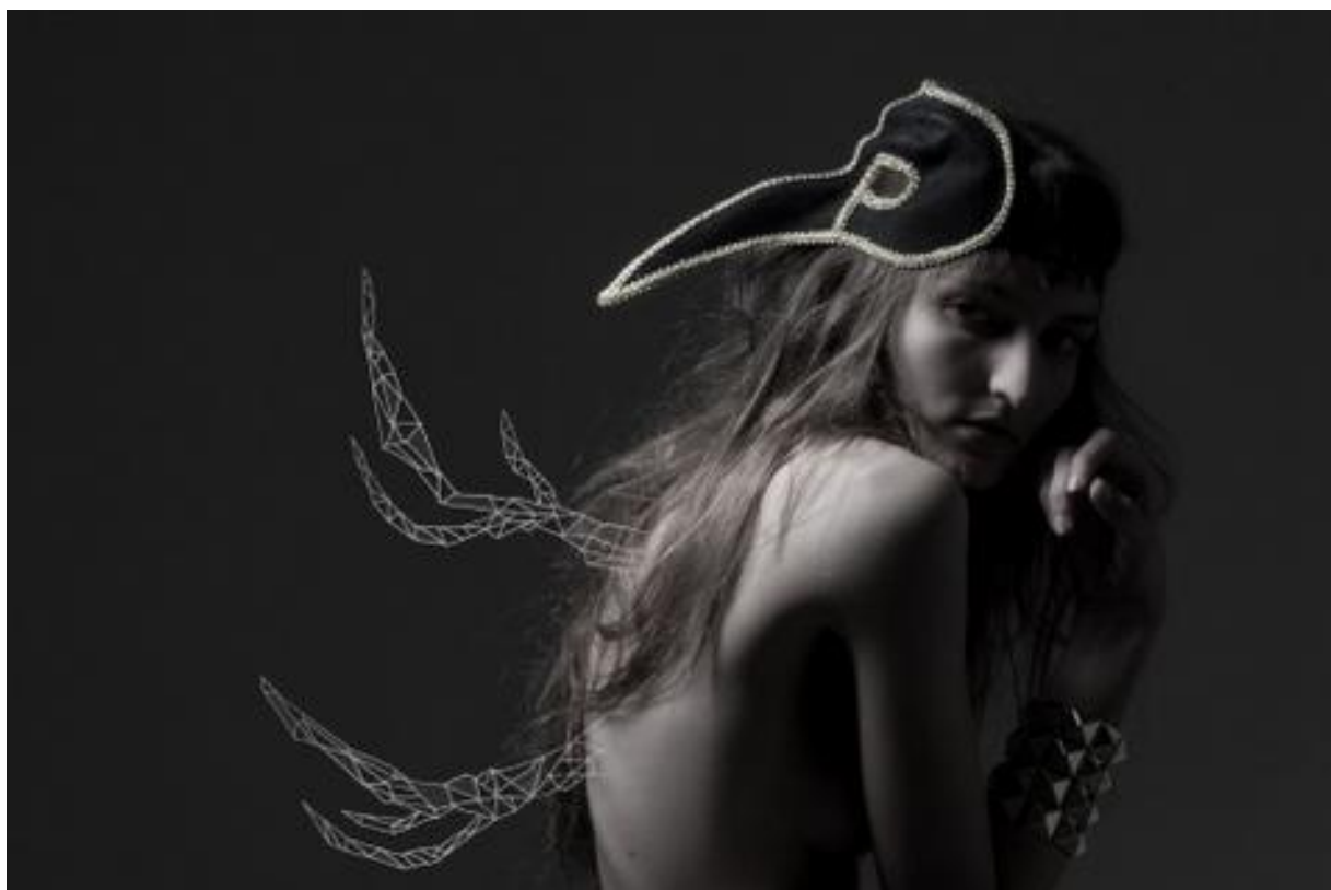
Figura 6 – Quinta Fotografia do Editorial, 2010.

O vôo dos pássaros os predispõe, é claro, a servir de símbolos às relações entre o céu e a terra. Em grego, a própria palavra foi sinônimo de presságio e de mensagem do céu. É essa a significação dos pássaros no taoísmo, onde os Imortais adotam a forma de aves para significar a leveza, a liberação do peso terrestre. Os sacrificadores ou as dançarinas rituais são freqüentemente qualificados, pelos brâmanes, de pássaros que levantam vôo para o céu. Na mesma perspectiva, o pássaro é a representação da alma que se liberta do corpo, ou apenas o símbolo das funções intelectuais. [...] A leveza do pássaro comporta, entretanto, como acontece freqüentemente, um aspecto negativo. São João da Cruz vê nela o símbolo das operações da imaginação, leves, mas sobretudo instáveis, esvoaçando de lá pra cá, sem método e sem seqüência; o que o budismo chamaria de distração ou pior ainda, de divertimento.