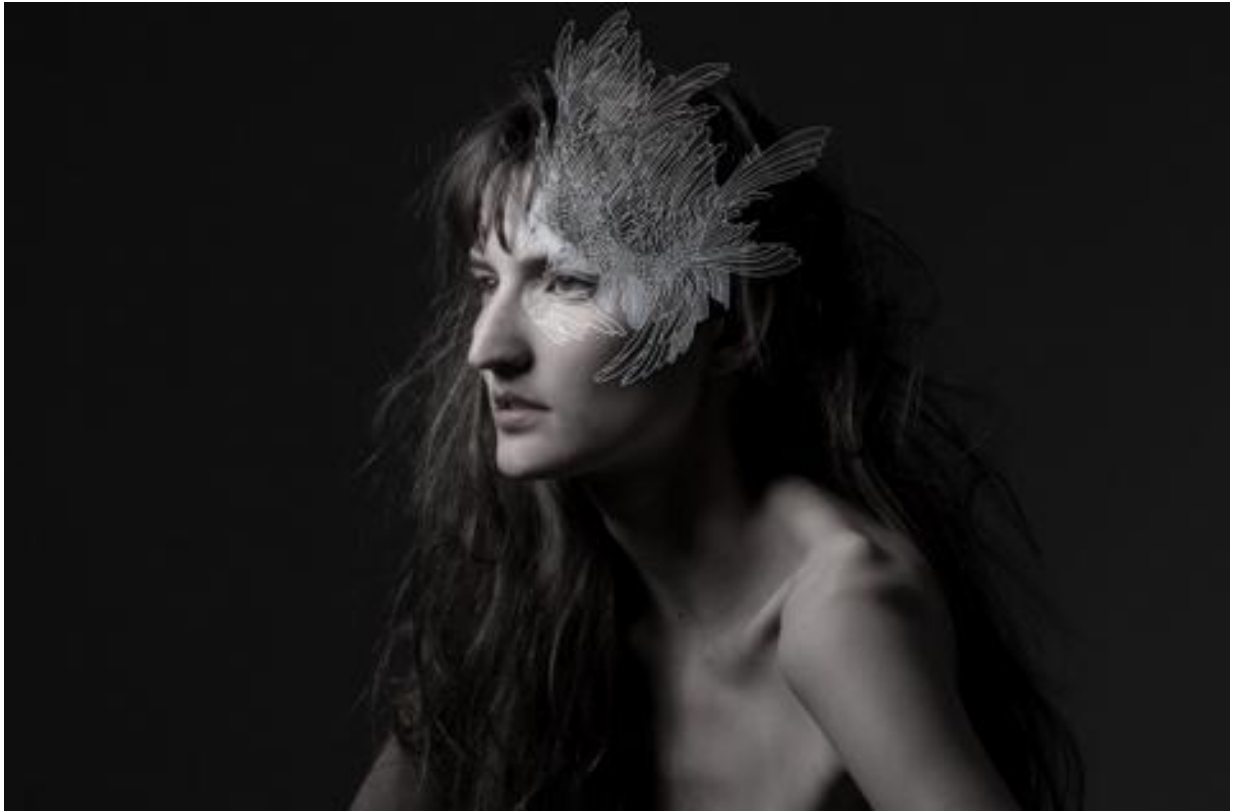
Figura 7 – Sexta Fotografia Do Editorial, 2010.