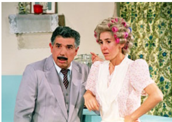
fig. 3 – Prof. Girafales e Dona Florinda no restaurante dela.