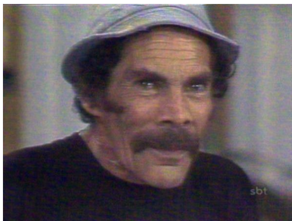
fig. 4 – Seu Madruga.