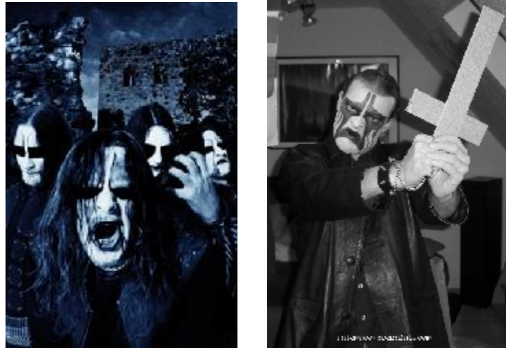
Figura 1 e 2 - corpse paint

As bandas precursoras do black metal moderno são: Venom , que inventou em 1981 o termo e deu o nome de seu segundo álbum de black metal, Bulldozer , Celtic frost , Helhammer , Mercyful Fate e Bathory , que lançou nos anos 80 um dos álbuns que se tornou paradigma, o Under the Sign Of The Black Mark .