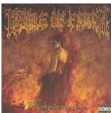
Figura 5: Capa de cd do álbum Nymphetamine

Em Nymphetamine , Cradle Of Filth faz um jogo de palavras, sendo a junção de palavras: ninfeta (jovem mulher desejável) com anfetamina: estimulante. Mostra a imagem de uma mulher em pose considerado sensual tendo ao seu fundo um aspecto de fogo . Nesse cd, são resgatados alguns elementos na sonoridade do passado, o thrash e heavy metal dos anos oitenta, fazendo a fusão do antigo com o novo.