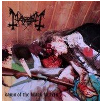
Figura 3: capa do cd Dawn of the black hearts da banda Mayhem .

ao vê-lo, foi à loja mais próxima e comprou uma máquina fotográfica, tirando assim, fotos do cadáver. Essas fotos serviram como capa do cd Dawn of the black hearts .