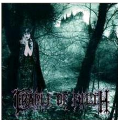
Figura 4: Capa de cd do Dusk... and Her Embrace com alusão da condessa Elizabeth Bathory.

No álbum Dusk... and Her Embrace vem com maiores passagens épicas , vocais femininos que dão um toque de erotismo e sadismo à música da banda e um clima de filme de terror, com partes orquestradas. Na capa tem a imagem da Condessa Elizabeth Bathory , que é também para Dani Filth inspiração nas suas histórias. Algumas versões desse cd foram lançadas dentro de um caixão.