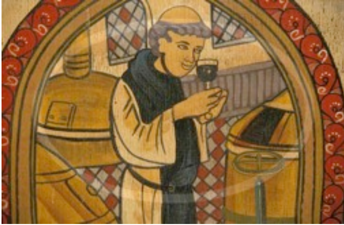
Foto 07- Monge tomando vinho, consumo muito popular na época.

Ainda na idade média produtos trazidos por mercadores aventureiros encheram as mesas dos ricos e abastados da época, onde os mesmos faziam muito uso de especiarias. Foi também nesse período que o contato com o mundo muçulmano aconteceu, levando as mesas o açúcar, noz-moscada, gengibre, hortelã entre outros ingredientes. A culinária moura marcou especialmente algumas cozinhas regionais espanholas.