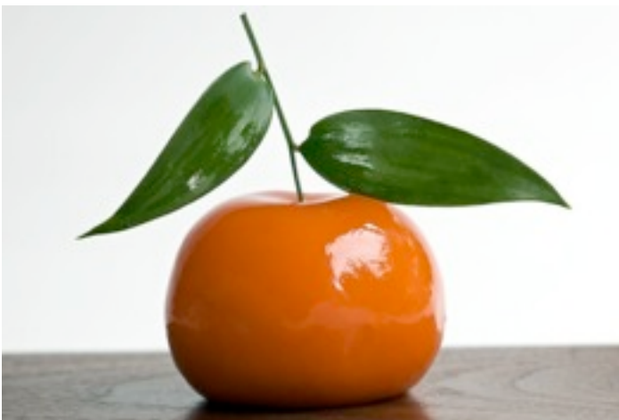
Foto 17- Meat fruit fechada .

O prato a ser analisado é uma entrada composta por patê cremoso de fígado de galinha envolto em suave geléia cítrica de tangerina e pão de campanha para ser comido junto ao patê.