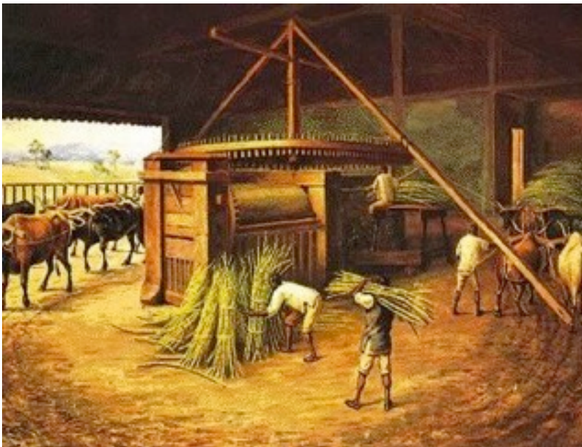
Foto 11- Escravos africanos trabalhando com cana de açúcar em um engenho.

A produção do café também estava em alta nesse período, tendo esse tomado os investimentos dos senhores de engenho que haviam desistido da produção do açúcar em sua época de decadência. Com a Lei Eusébio de Queirós em 1850 o tráfico de escravos para o Brasil foi definitivamente proibido, o que levou os cafeicultores a incentivarem a vinda de europeus para trabalharem nos cafezais aqui no país. Com a abertura para que tais povos viessem ofertar sua mão-de-obra aqui, o Brasil passou a receber um grande número de italianos, que passaram a contribuir diretamente com a cultura gastronômica local.