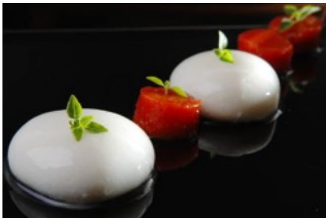
Foto 16- Salada caprese esferificada.