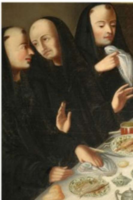
Foto 06- Monges ceiando.