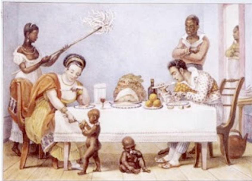
Foto 10- Família portuguesa no Brasil se alimentando próximo a suas mucamas.

condição de escravos, não podiam escolher quanto nem o que comer, por isso criavam e adaptavam de acordo com aquilo que lhes era oferecido como sustento (BASSI, 2006, p. Artigos).