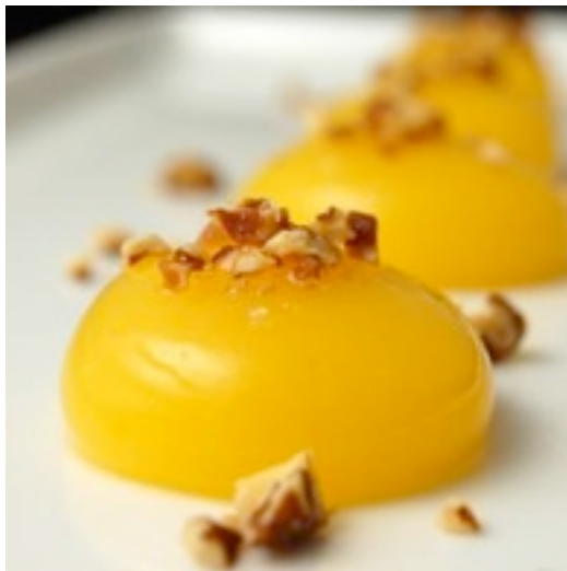
Foto 15- Esferificação de manga.

conhecimento químico do que acontece na preparação dos alimentos. A técnica propagada pela Cozinha Molecular ainda utiliza equipamentos de laboratório para colocar em prática métodos científicos ao alcance da culinária.” Métodos esses conhecidos por nomes tão complexos quanto seus próprios sabores encantam pela manutenção de uma gastronomia contemporânea tão diferenciada, e com suas esferificações, gelatinizações e espumas enchem os olhos dos que se aventuram nessa distinta experiência.