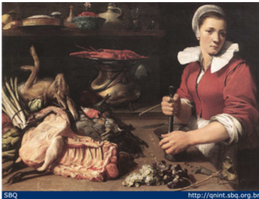
Foto 09- Mulher preparando especiarias para utilizar nas carnes do jantar.

Os costumes da França se espalharam por outros países da Europa. E foi a mesma França que presenciou, em Paris, o surgimento do primeiro restaurante – um estabelecimento pequeno que tinha as sopas como prato a ser comercializado. Pouco mais tarde, o La Grande Taverne de Londres despontou também em Paris como restaurante de luxo oferecendo serviços à la carte. O principal diferencial dos restaurantes em relação aos seus antecessores – cabarets, albergues e tavernas – era a limpeza, a tranqüilidade, o espaço e a decoração aprimorada. (FRANCO, 2004, p. 207)