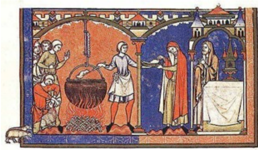
Foto 05- Preparação de comida por monges.

Não só da produção de vinho se faziam os monges, foram eles também os principais responsáveis pela cidra e a cerveja. A pesca no oceano Atlântico também era bem desenvolvida na idade média, onde os pescado além de barato compunha a dieta dos cristãos que se abstinham de carne em algumas datas do ano. Tanto a grande variedade de bebidas, quanto de comida compunham os banquetes dos mosteiros, onde mesas sempre fartas estavam presentes na vida dos religiosos.