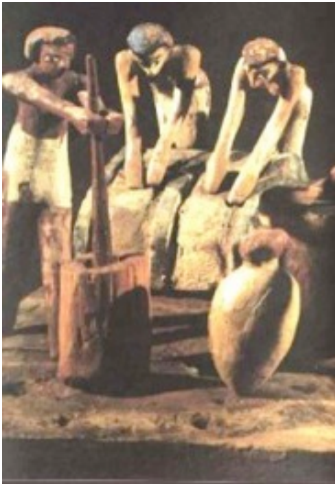
Foto 4- Egípcios confeccionando o pão. Fonte: http://www.paopinheirense.com.br/blog/tag/alimento

Foto 3- Egípcios fazendo farinha para o pão. Fonte: http://www.paopinheirense.com.br/blog/tag/alimento