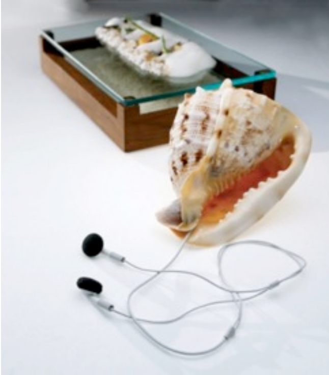
Foto 14- Prato de Heston Blumenthal “the sound of the sea”.