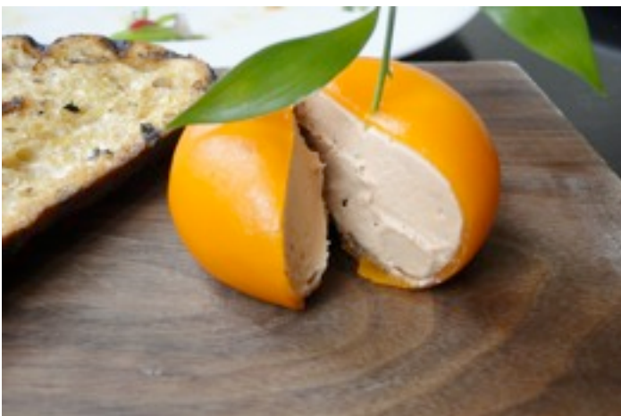
Foto 18- Meat fruit aberta com pão de campanha .