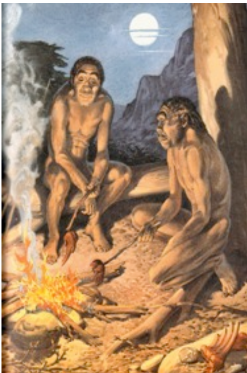
Foto 1- Homens pré-históricos assando a carne de um animal.

A alimentação e a comida tiveram sua origem ainda na pré-história, com o desenvolvimento de ferramentas para a caça de animais, o início da agricultura pelos nômades e principalmente pela descoberta do fogo. O fogo foi primordial para que a alimentação se desenvolvesse e caminhasse para o que conhecemos hoje. Foi ele quem tornou os alimentos mais saborosos antes mesmo da descoberta do sal, realçou sabores e permitiu uma validade mais duradoura as carnes da época. “O fogo foi o primeiro tempero descoberto pelo homem, já que o sabor de uma comida depende da temperatura em que ela é consumida.” (LEAL, 1998, p.17).