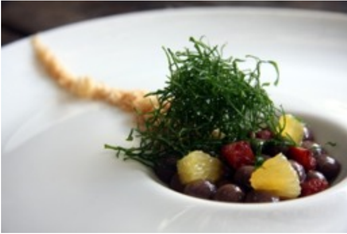
Foto 13- Feijoada modernista de Helena Rizzo .