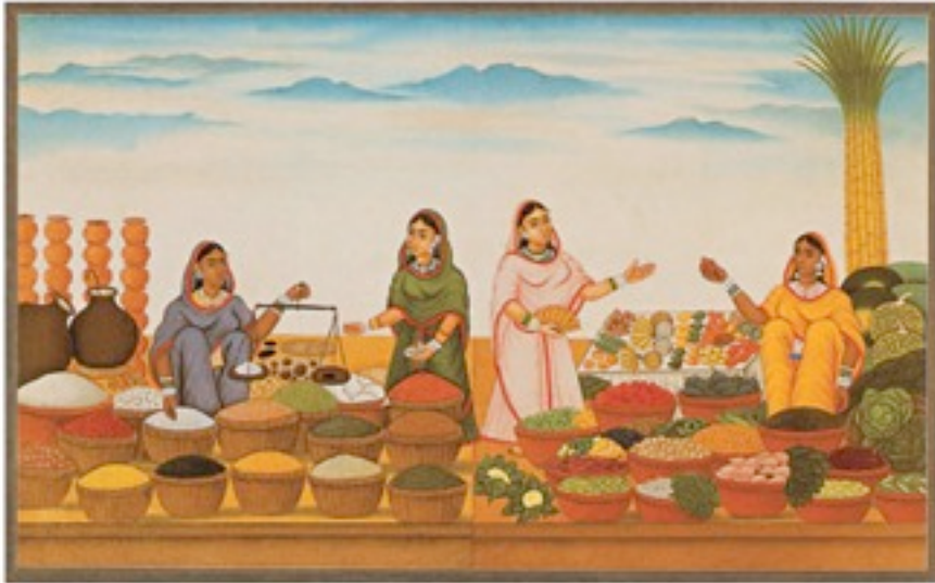
Foto 08- Mulheres indianas em feira de especiarias .

Os comerciantes venezianos e genoveses, que viajavam até a Ásia Central, eram o ponto de união entre o Oriente e o Ocidente. Na mesma época, missionários cristãos estavam indo mais longe ainda e enviavam a seus superiores relatórios em que narravam maravilhas. (FRANCO, 2006, p. 92)