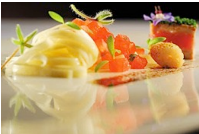
Foto 12- Prato em linha modernista.

Atentos ao que há de mais inventivo e inusitado na gastronomia mundial, muito chefs nacionais e internacionais buscando encantar seus clientes têm olhado para uma outra tendência na arte de se fazer e produzir alimentos, a gastronomia molecular. Da qual falaremos a seguir.