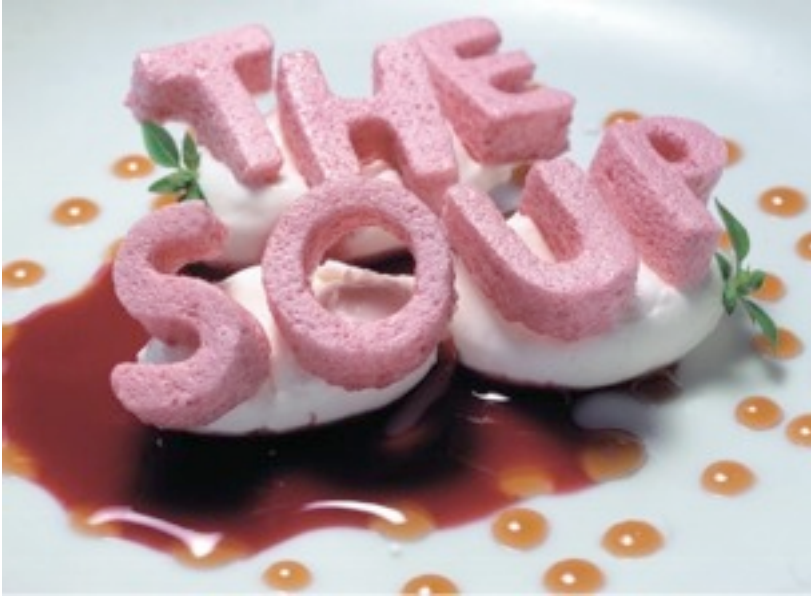
Foto 19- “The Soup” de Adrià.

Da mensagem plástica de The soup (quadro 1):