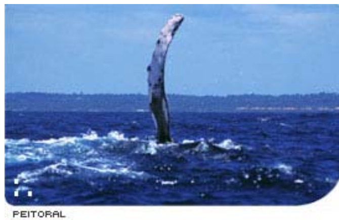
Figura 3 – Nadadeira peitoral da baleia jubarte. Observa-se o tamanho grande e coloração branca na parte de baixo e preta na parte de cima.

O borrifo desta espécie pode atingir cerca de 3 metros de altura e em geral tem forma de balão ou coluna. Este borrifo quando a caça às baleias era permitida, fazia com que os baleeiros pudessem saber a direção exata da baleia para jogar os arpões e até identificar a espécie (Hetzl e Lodi, 1993).