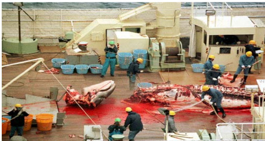
Figura 7 – Navio japonês de pesca de baleias.

Por outro lado, a volta da caça é incompatível com a mentalidade de uso sustentável não-letal das baleias como patrimônio científico, ecológico e cultural. Seria um prejuízo econômico para as comunidades que estão se beneficiando do turismo de observação de baleias, e um grave retrocesso cultural em que os valores intrínsecos de um patrimônio natural comum seriam destruídos em favor de um único e menor valor - o lucro privado dos baleeiros. Assim mesmo, ainda há quem defenda a volta da caça às baleias no Brasil (IBAMA, 2003).