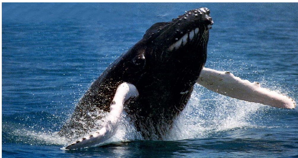
Figura 8 – A baleia jubarte no litoral baiano. O número de avistagens de baleias está crescendo devido ao aumento de indivíduos que “procuram” o hemisfério sul para se reproduzir.

A criação do Santuário do Atlântico Sul será de extrema importância para a proteção das baleias, porque complementar a área atualmente protegida pelo Santuário do Oceano Antártico, que irá desde as águas congeladas da Antártida até as águas quentes do Equador e será vital para a conservação efetiva das baleias. O estabelecimento desse santuário significa que as baleias do hemisfério sul poderiam viver a vida toda em uma área livre da caça comercial (IBAMA, 2003).