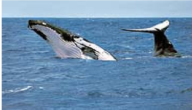
Figura 5 – Foto da baleia jubarte no litoral baiano indo à tona para respirar.