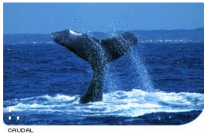
Figura 4 – Nadadeira caudal da baleia jubarte. Nota-se a forma de borboleta com recortes e reentrância central.