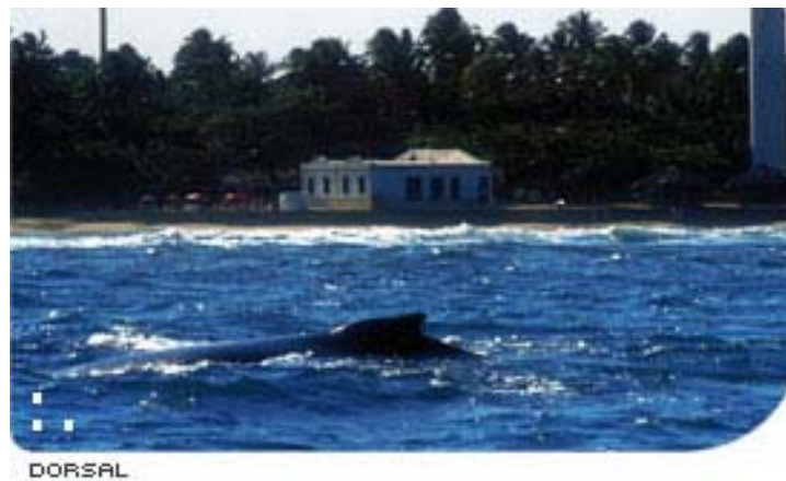
Figura 2 – Nadadeira dorsal da baleia jubarte. Nota-se que tem tamanho pequeno e é achatada