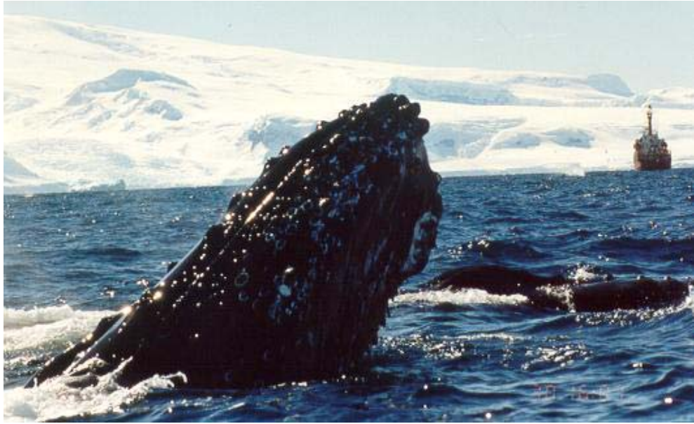
Baleia jubarte na região da Antártida. Nota-se a cabeça coberta de tubérculos.