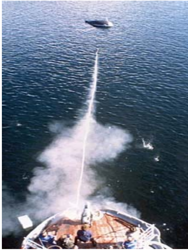
Navio japonês de caça de baleias. Observa-se o arpão indo em direção a baleia .