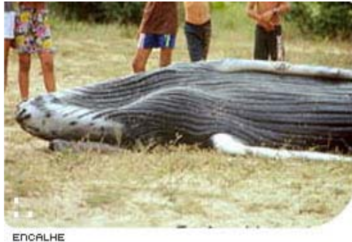
Figura 6 – Baleia jubarte encalhada na praia de Ubatuba em São Paulo em 2001.