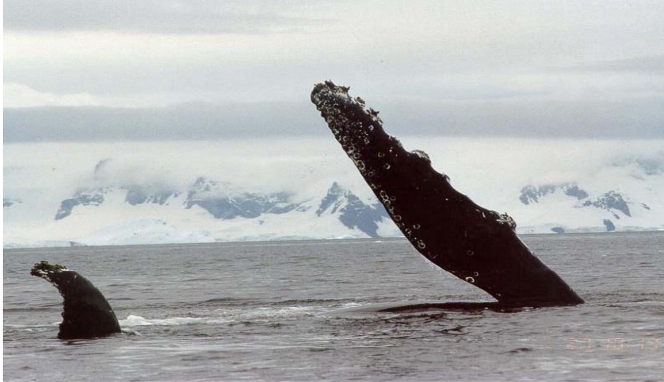
Baleia Jubarte na região da Antártida.