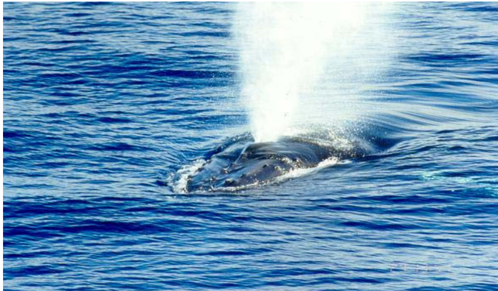
O borrifo da baleia jubarte.