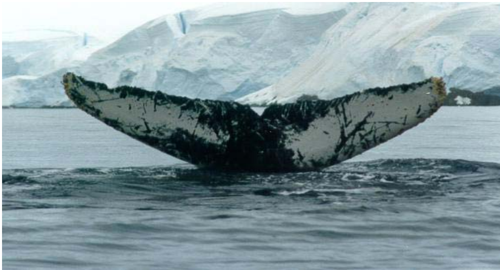
Nadadeira caudal da baleia jubarte. Foto de Marcelo Santos