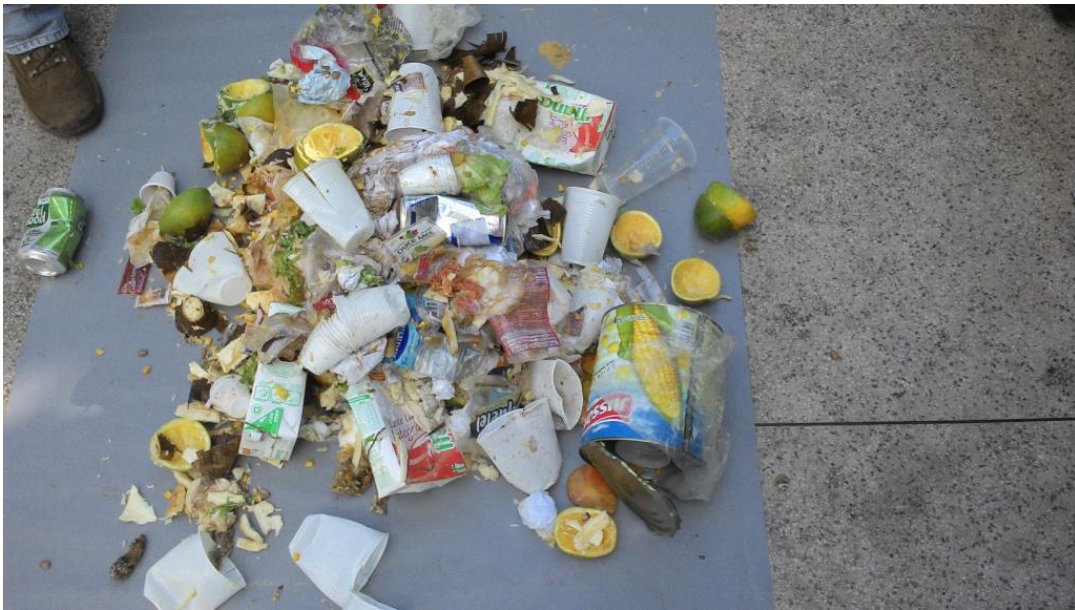
Figura 6. Grande quantidade de resíduos inorgânicos presentes no resíduo de lanchonete.