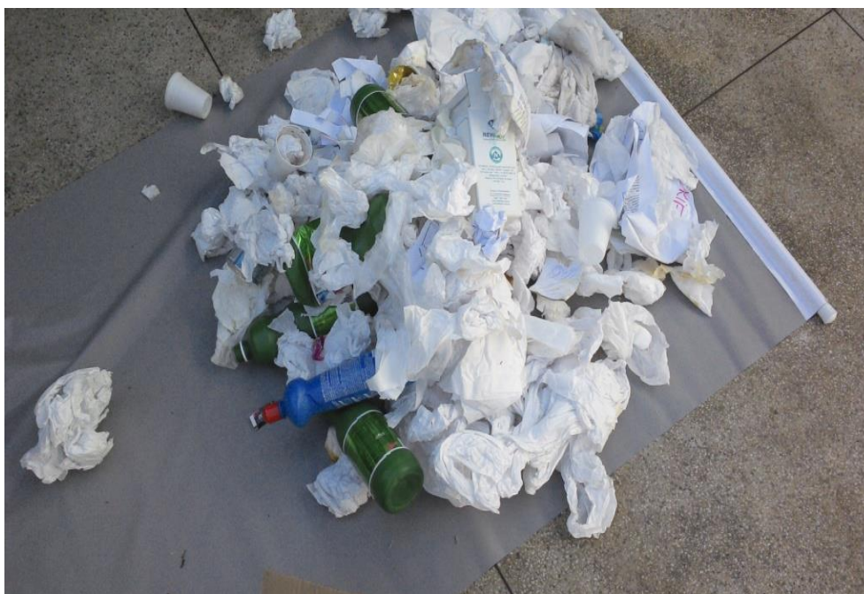
Figura 2. Mistura de resíduos inorgânicos com orgânicos oriundos de banheiro.