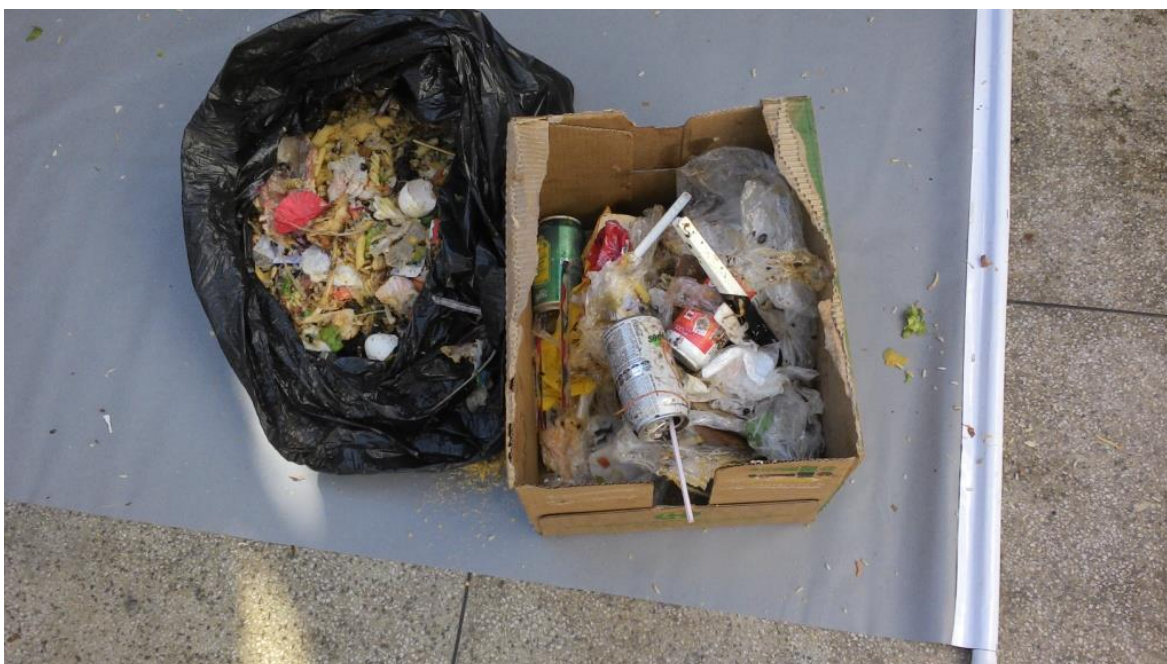
Figura 5. Separação de resíduos orgânicos de inorgânicos.