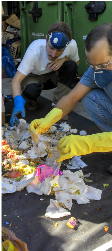
Figura 7. Resíduos inorgânicos de baixo peso.