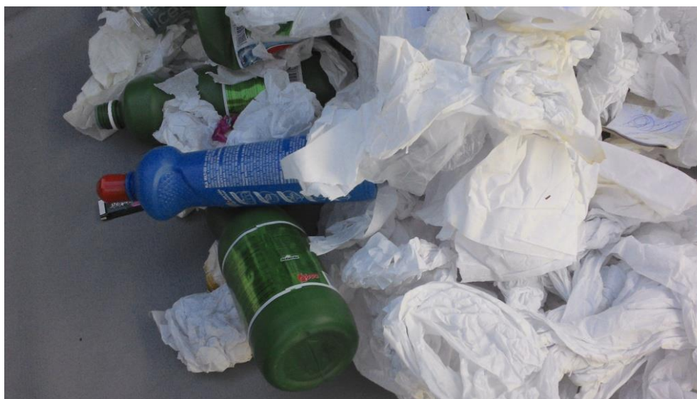
Figura 3. Descarte indevido de material de limpeza.

Já a gravimetria da lanchonete, 81% da massa pesada era composta por resíduos orgânicos e apenas 19% da quantidade de resíduos analisados se classificaram como inorgânicos (figura 4). Apesar dos números mostrarem uma porcentagem pequena desses, na análise da quantidade de itens encontrados, foi constatado a contaminação em 100% da amostra. Algumas amostras os inorgânicos apresentaram proporções volumétricas maiores ou igual ao dos resíduos orgânicos