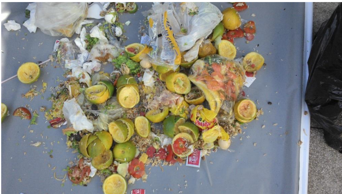
Figura 4. Resíduos provenientes de lanchonetes.

(figuras 5 e 6). Esse fato se deve a composição, que em sua maioria, são papeis, plásticos, latas e embalagens (figura 7).