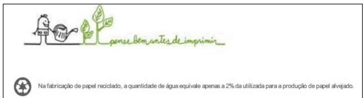
Figura 2. Exemplos de notas de rodapé que sensibilizam a redução da impressão.

A contribuição dos funcionários da instituição nos programas de coleta seletiva, principalmente em relação ao papel tem ocorrido na instituição sem resistência dos mesmos, pelo contrário, o que pode ser observado pelo número de participações voluntárias na separação do material, porém ainda é necessário atingir um numero maior de setores. Além do que, o monitoramento das ações e o contato