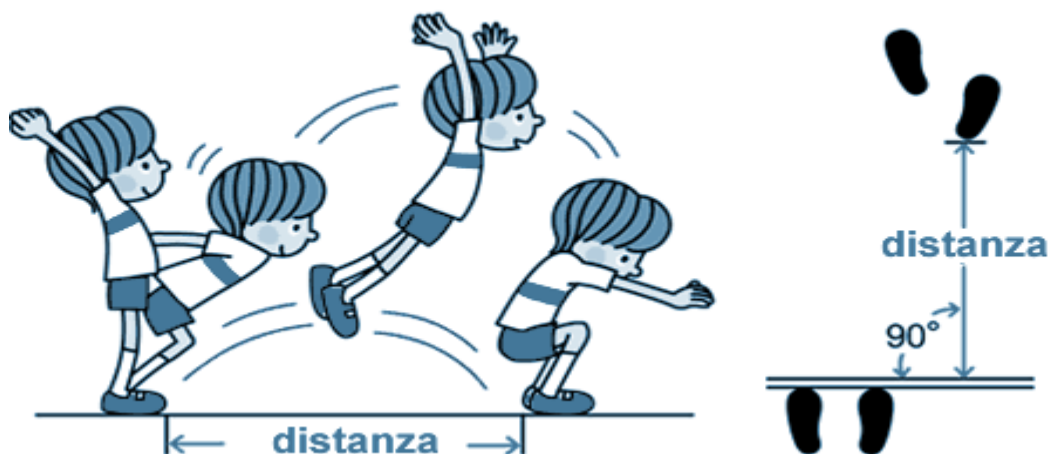
Figura 01:

Precaução: Invalidar o salto que for precedido de marcha, corrida, outro salto ou deslize após a queda.