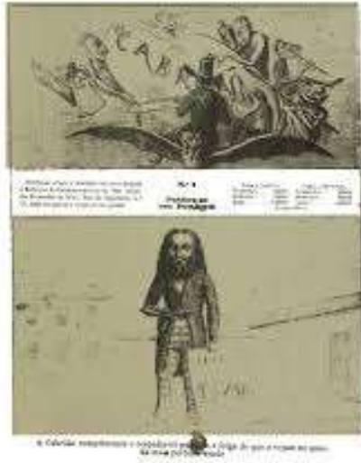
Figura 4: