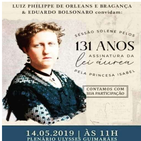
Figura 7:

bondade ou de reconhecimento da condição humana de nós negros”, assegura.