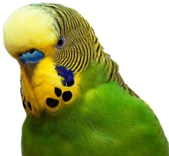
Anexo 5: Melopsittacus undulatus