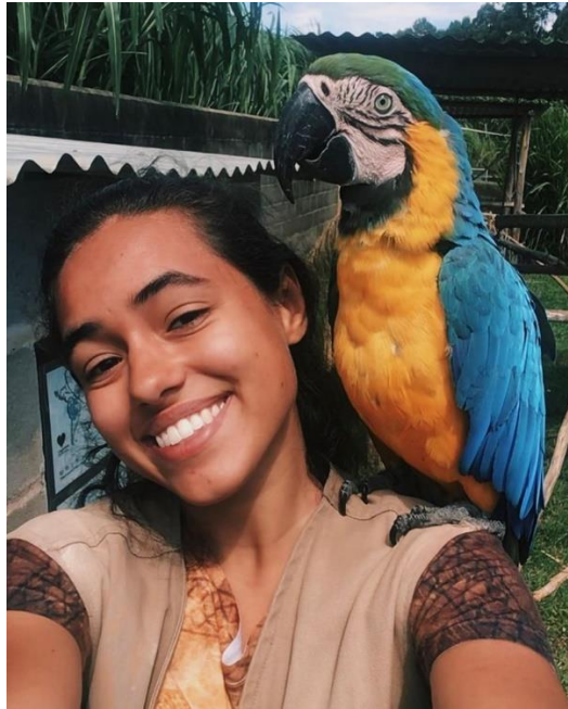
Anexo 4: Ara ararauna