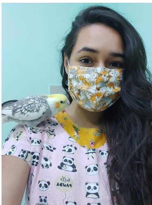
Figura 3: Nymphicus hollandicus