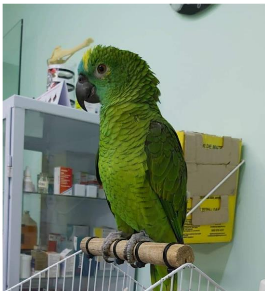
Figura 3: Amazona sp.