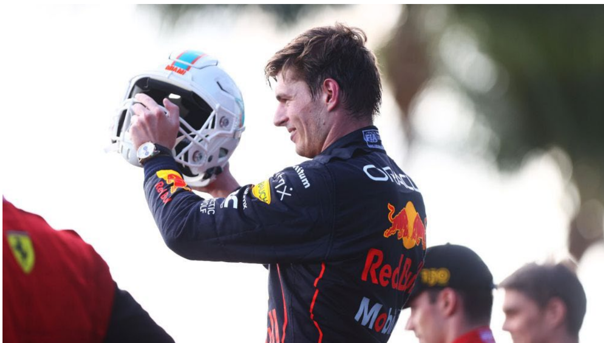
FIGURA 7: Max Verstappen celebra a vitória no GP de Miami 2022