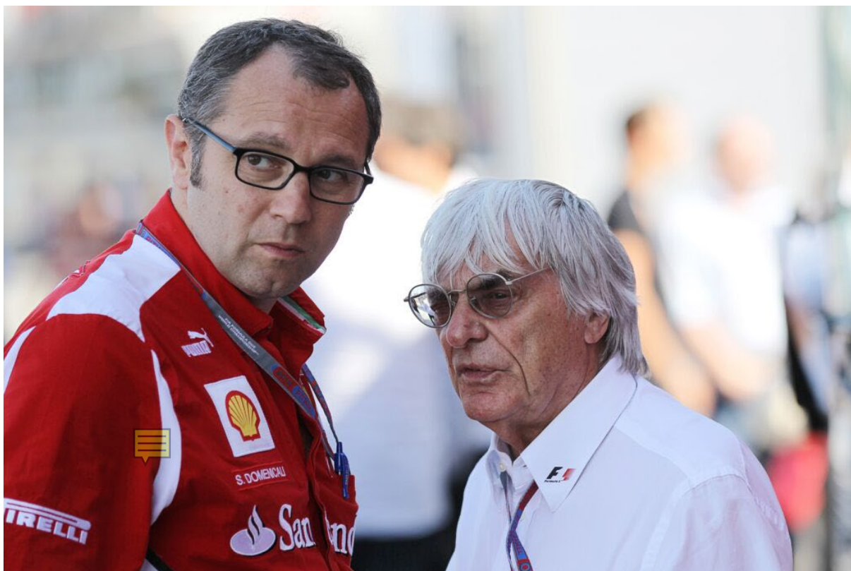
FIGURA 1: Estefano Domenicali e Bernie Ecclestone conversando anos atrás