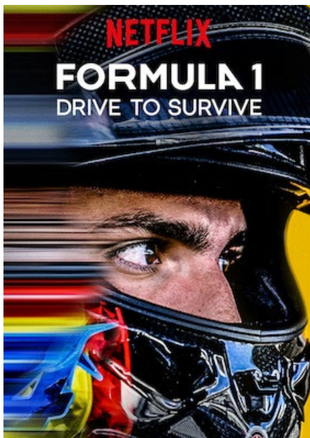
FIGURA 6: Série documental publicada pela Netflix, Drive to Survive .

Anteriormente no trabalho foi citada a série documental Drive to Survive , série que teve sua primeira temporada publicada pela Netflix, em fevereiro de 2019. A série, que é um sucesso com o público e possui nota 8,7/10 no agregador de notas IMDb. A série, que está na sua quarta temporada e já foi renovada para mais dois anos, acompanha os pilotos e as equipes durante todo o desenrolar da temporada, revelando dramas de bastidores, histórias individuais de cada piloto e equipe, dando atenção a momentos que ocorreram durante a temporada e que não tiveram tanto destaque nas transmissões oficiais das corridas e na mídia em geral.