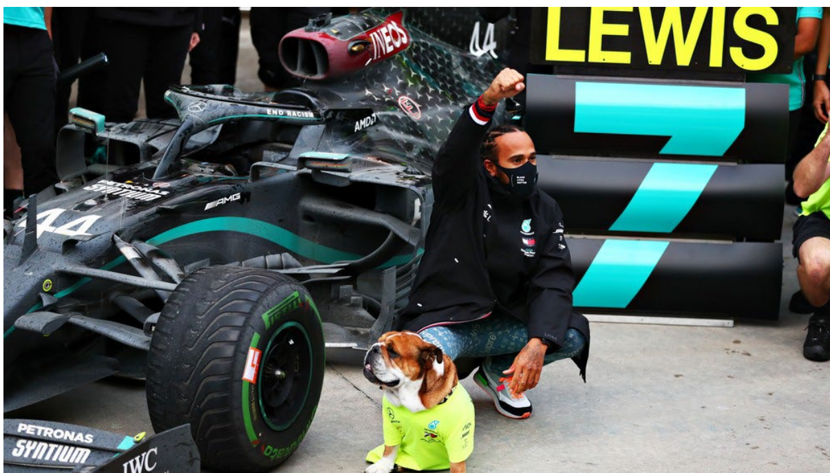
FIGURA 3: Lewis Hamilton, em 2020, celebrando seu sétimo título.

Para promover a campanha We Race as One a Formula 1 contou com o auxílio de todos os pilotos e equipes que fazem parte da categoria. Todas as equipes chegaram a fazer mudanças na pintura de seus carros para a temporada de 2020, por conta da campanha We Race as One . A equipe Mercedes inclusive correu com seus carros pintado na cor preta, ao invés da tradicional cor prata de seus carros, durante as temporadas de 2020 e 2021. Essa mudança completa na pintura foi feita com o intuito de mostrar o comprometimento da equipe, que conta com Lewis Hamilton como um de seus pilotos, no combate ao racismo e em apoio ao movimento Black Lives Matter 3 .