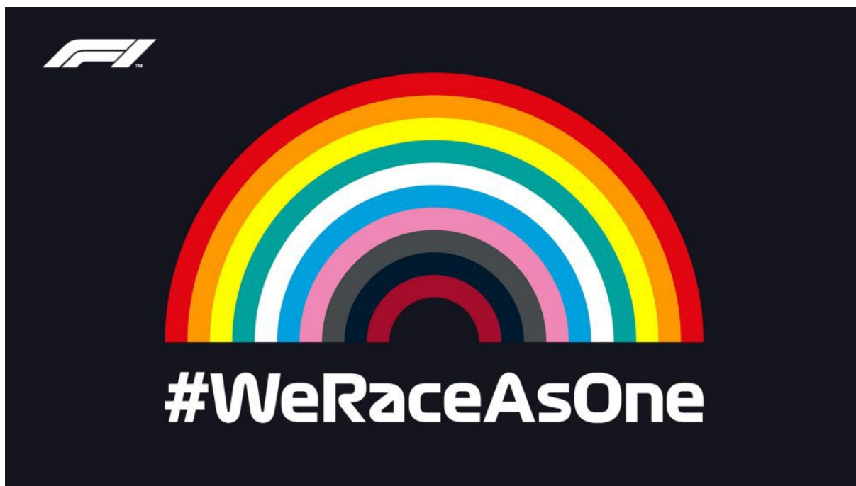
FIGURA 4: Logo da campanha We Race as One .